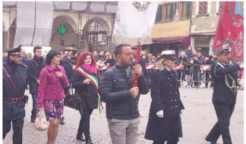
La sfilata che precede lo scoppio del carro a Figline Valdarno

che, se tutto andrà bene, si concluderà con l'accensione di una girandola dalla quale usciranno tante bandiere. Intanto la colombina, sempre se tutto andrà bene, sarà tornata nella collegiata. Il tutto ripreso da centinaia di telefonini che rilanceranno lo spettacolo sui social. Molto interesse è riversato sul 'volo' della colombina, perché antiche tradizioni lo legano ai raccolti che verranno. Finora solo poche volte la colombina non è tornata alla base.